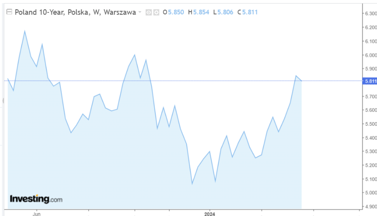
Rysunek 2. Rentowność 10-letnich obligacji Skarbu Państwa